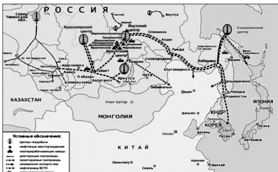
Рис. 2. Схема размещения центров газодобычи и проектируемых газопроводов в Восточной Сибири и на Дальнем Востоке

В настоящее время сложились благоприятные предпосылки для начала формирования в восточных регионах страны новых центров газовой промышленности общероссийского значения и расширения Единой системы газоснабжения на восток (рис. 2). Такие предпосылки обусловлены значительным приростом запасов газа в восточных регионах страны – Иркутской и Сахалинской областях, Республике Саха (Якутия), Красноярском крае.